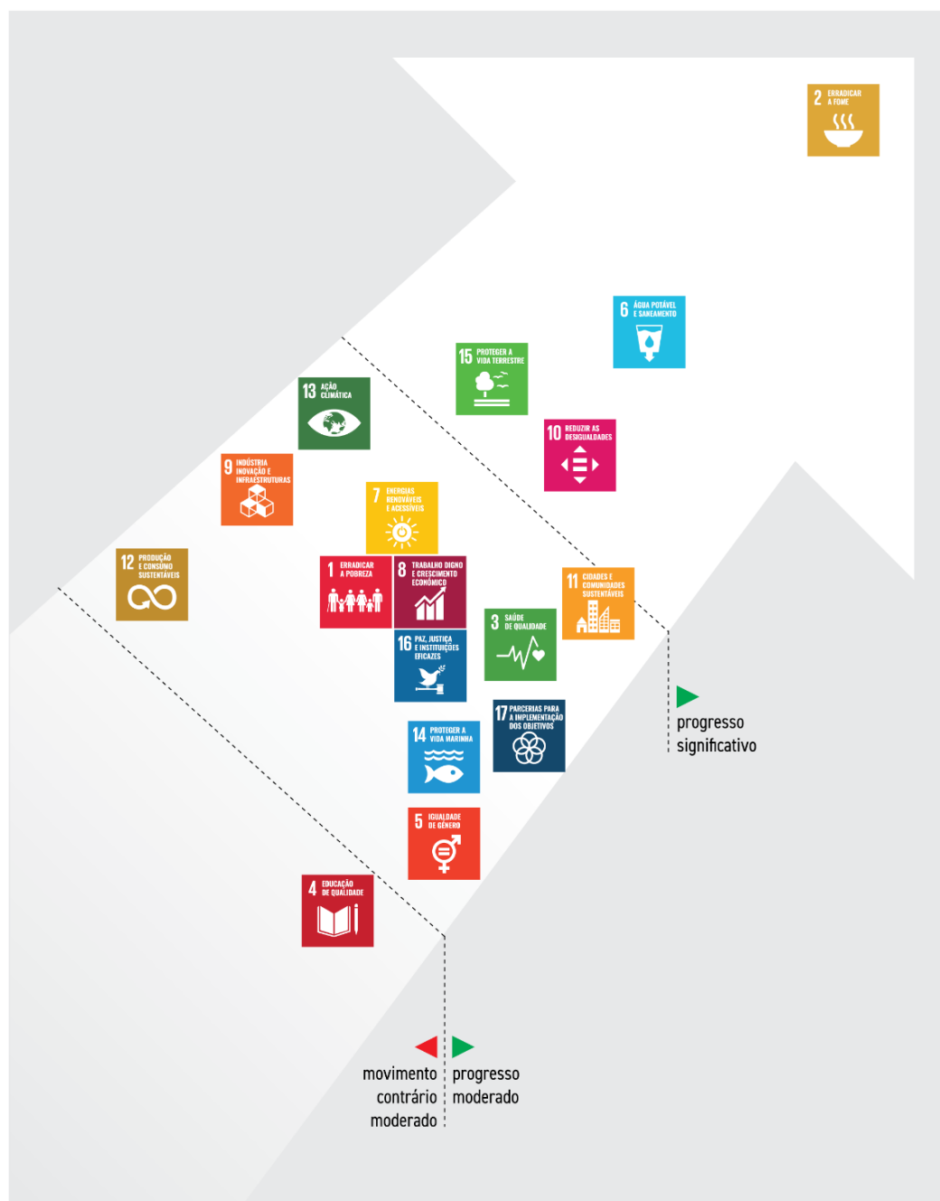
Figura 3. Posicionamento dos ODS em Portugal de acordo com a sua evolução no período 2015-2025

A partir da pontuação dos indicadores globais por ODS e da aplicação da metodologia do Eurostat, foi possível avaliar o desempenho dos 17 ODS e proceder ao seu posicionamento conjunto de acordo com a evolução observada no período 2015-2025 (Figura 3).